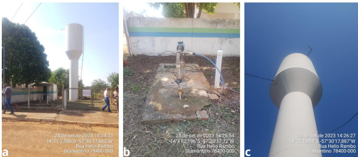
Figura 1: a) Vista geral das estruturas do SAA de Deciolândia; b) Vista do poço de captação de água bruta e do clorador; c) Vista do Reservatório de água.

Os registros das estruturas do SAA de Deciolândia estão na figura 1.