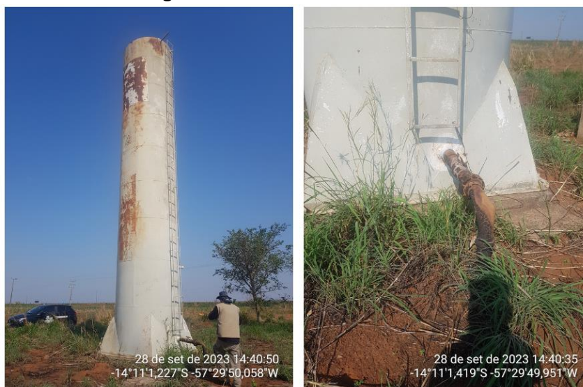
Figura 2: Reservatório desativado.

Durante o processo de fiscalização foi apresentado o interesse da população de Deciolândia em reativar um reservatório existente no Distrito, para que tal ação possa ocorrer é necessário realizar uma avaliação e análise das condições de operação do mesmo. Na figura 2 está o registro do reservatório em questão.