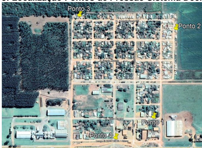
Figura 3: Localização Pontos de Pressão Sistema Deciolândia.